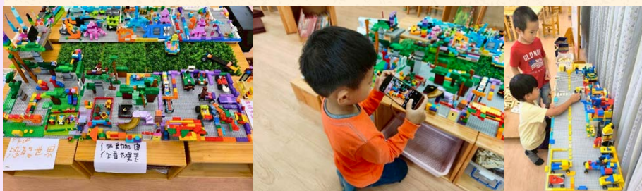
用建構好的LEGO動物及海洋世界拍攝故事繪本

孩子們也運用自己的建構作品來呈現故事，從構思故事內容開始，自己拍攝圖片、將故事內容錄音，讓組合建構區結合了語文活動，發展出孩子更多面向的能力！