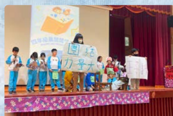
四年級閱讀發表戲劇演出