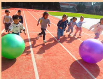
大龍球追趕跑遊戲

團隊合作傳球中，大龍球的重量與體積，要保持在平衡，需專注於自己的動作讓球不偏離方向，和彼此溝通、支持，才能讓球順利前進，表現出充分的合作力。